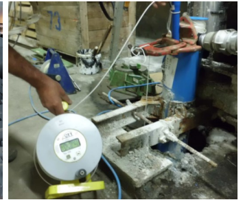
Mesure de la température de la nappe des calcaires du Lutétien