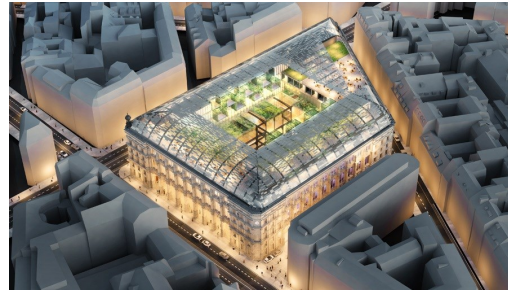
Poste du Louvre : projet de reconstruction (Le Moniteur)